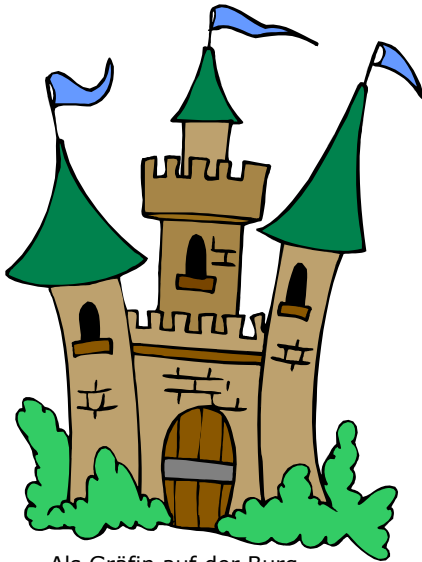
Als Gräfin auf der Burg